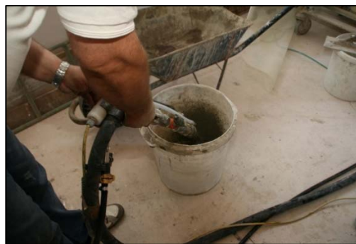
Obrázek 13 Zkouška a nastavení stroje

Pro nanášení lepidla použijte stroj v konfiguraci bez vzduchového kompresoru a upravte výkon čerpadla. Pro nanášení směsi doporučujeme použití stříkací pistole s přídatnou (delší) hubicí pro snazší aplikaci. Lepidlo se nanáší zpravidla v souvislém pásu po obvodu desky a ve tvaru „W“ v ploše desky viz. obr. 14. Důležité je v tomto případě dodržet plochu lepení předepsanou výrobcem ETICS. Desku následně nalepte na podklad.