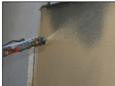
Obrázek 11 Stříkání omítky strojem PFT RITMO

Při rovnoměrném nanesení omítky není nutné u zatírané struktury provádět strukturování omítky jejím zatočením plastovým hladítkem tak, jako u ručního nanášení.