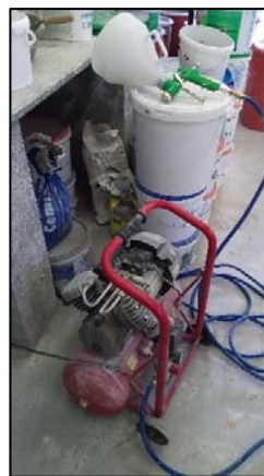
Obrázek 7 Možná konfigurace pistole s kompresorem

Na rozdíl od strojních omítaček jsou stříkací pistole i s kompresorem poměrně lehké a relativně snadno přenositelné po lešení, navíc je lze snadno vyčistit, materiál, který zůstane v zásobníku po skončení práce lze vrátit do kbelíku, takže nejsou žádné ztráty materiálu v hadicích.