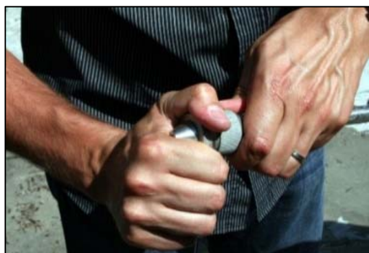
Obrázek 4 Výměna trysky