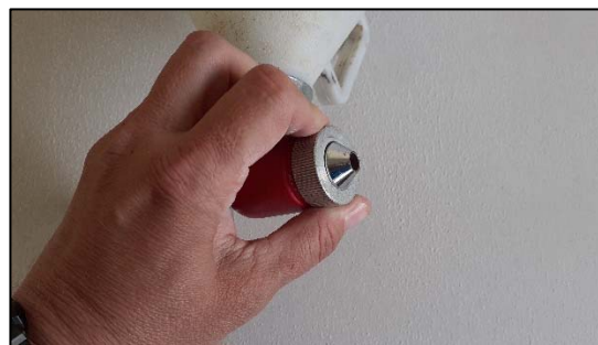
Obrázek 19 Montáž trysky