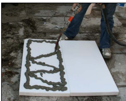
Obrázek 14 Nanášení lepidla