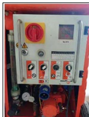
Obrázek 3 Ovládací panel stroje