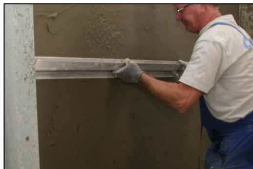
Obrázek 17 Finální zarovnání stěrkové vrstvy