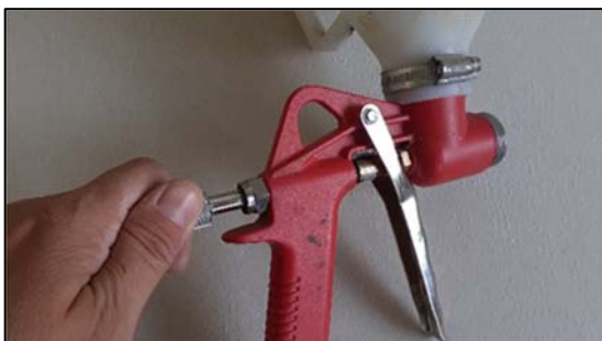
Obrázek 20 Seřízení pístu

Samotnou omítku je nutné před použitím důkladně promíchat míchadlem. Následně se omítka nadávkuje do zásobníku pistole, otevře se přívodní ventil vzduchu na pistoli a může být zahájeno samotné stříkání viz. obr. 23.