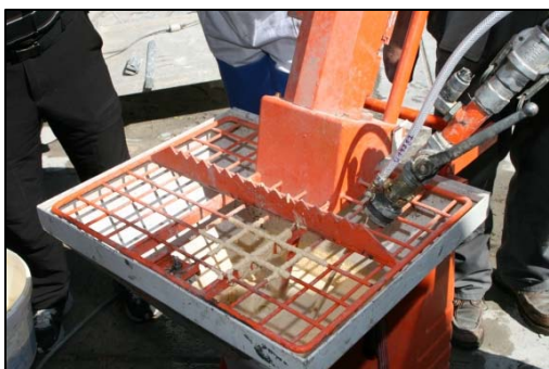
Obrázek 10 Nastavení tlaku vzduchu a výkonu čerpadla

Při nanášení omítky stříkáním na připravený podklad viz. obr. 11 dbejte na rovnoměrnou tloušťku nanášené vrstvy, tedy takovou, aby mezi zrna neprosvítal podklad, ani aby nebyla omítka nanesena v příliš silné vrstvě a nestékala.