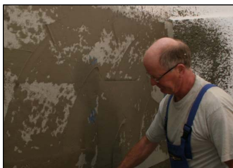
Obrázek 16 Zapracování síťoviny do stěrky

Pro nanášení stěrkové hmoty použijte stroj v konfiguraci s přidavným vzduchovým kompresorem. Aplikaci stěrkové hmoty provádějte se standardní stříkací hubicí bez přidavné hubice. Hmotu nastříkejte rovnoměrně na podklad viz. obr. 15, zapracujte do ní výztužnou síťovinu viz. obr. 16, doplňte stěrkovou hmotou nastříknutím tenké vrstvy a zarovnejte do roviny viz. obr. 17.