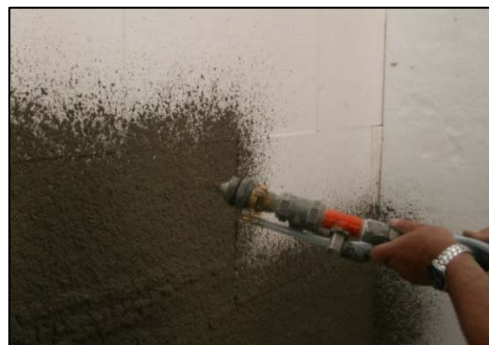
Obrázek 15 Nanášení stěrkové hmoty

Pro nanášení stěrkové hmoty použijte stroj v konfiguraci s přidavným vzduchovým kompresorem. Aplikaci stěrkové hmoty provádějte se standardní stříkací hubicí bez přidavné hubice. Hmotu nastříkejte rovnoměrně na podklad viz. obr. 15, zapracujte do ní výztužnou síťovinu viz. obr. 16, doplňte stěrkovou hmotou nastříknutím tenké vrstvy a zarovnejte do roviny viz. obr. 17.