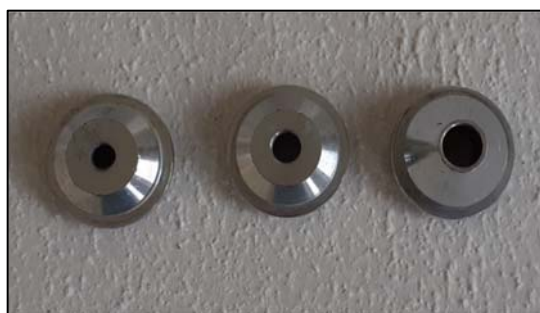
Obrázek 18 Trysky o Ø 4, 6 a 8 mm

Před aplikací se podle zrnitosti stříkané omítky namontuje na pistoli vhodná velikost trysky – její průměr by měl činit cca trojnásobek velikosti zrna omítky viz. obr. 18 a 19.