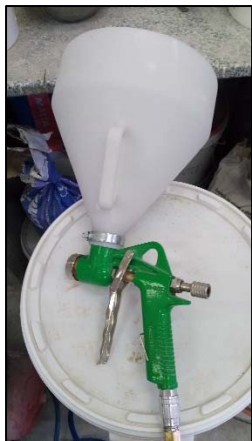
Obrázek 6 Stříkací pistole pro omítky se zásobníkem

Tímto typem zařízení lze stříkat všechny typy pastovitých omítek Cemix kromě omítky Cemix 2729 TETRACEM. Tuto omítku lze stříkat také, ale je nutné použít stroj PFT RITMO dle podmínek popsaných v bodě 2.1.