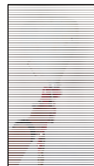
Obrázek 22 Zahájení stříkání

Vhodnost trysky, seřízení pístu pistole a funkčnost celého zařízení je nutné nejdříve vyzkoušet na zkušební ploše a případně nastavení upravit.