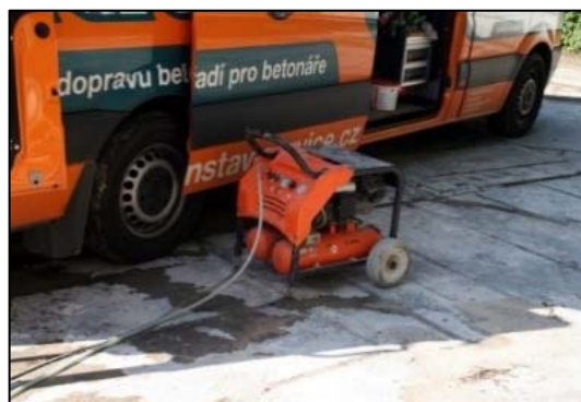
Obrázek 5 Přídavný kompresor