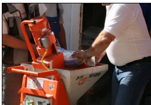
Obrázek 12 Vsyávání suché maltové směsi do zásobníku

Pro variantu stříkání lepicích a stěrkových hmot je nutná přípojka vody hadicí 3/4" a provozní tlak vody 3,5 bar. Obsah pytle vsypte do násypky stroje viz. obr. 12. Nastavte konzistenci směsi úpravou dávkování vody a konzistenci vyzkoušejte do nádoby viz. obr. 13.