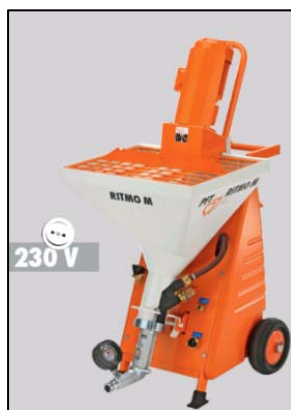
Obrázek 2 Stroj PFT RITMO M