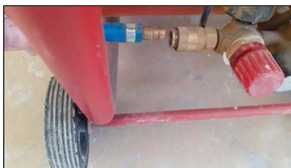
Obrázek 22 Připojení hadice ke kompresoru